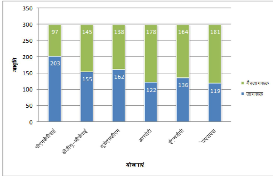
क्रॉस सारणीयन, योजनावार व लिंगवार तथा आयुवर्गवार जागरूकता का विवरण